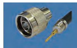
N-P 型コネクター (脱着式)